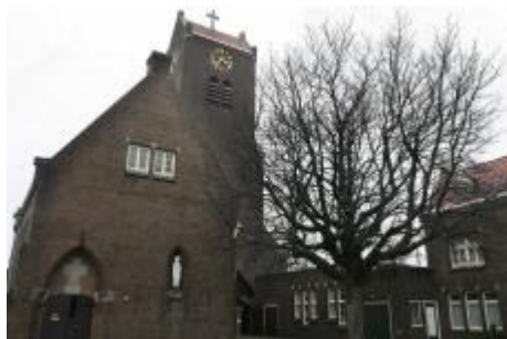
Mijn laken van de Arendsweg.

Al jaren... en bijna iedere dag fiets ik over de Arendsweg, langs de bekende huizen, je weet elk kuiltje. Ook achter welke auto er een paas kan oversteken.